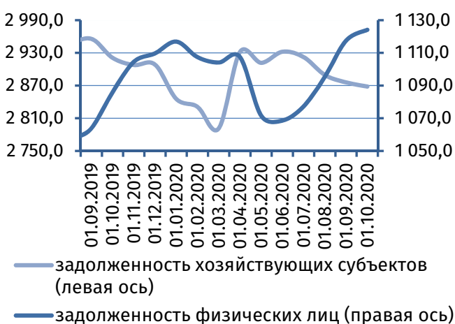
Рис. 4. Динамика задолженности по кредитам, 2 млн руб.

Результаты деятельности коммерческих банков республики в сентябре 2020 года характеризовались формированием чистой прибыли в сумме 11,7 млн руб. (в августе 2020 года – 14,1 млн руб.).