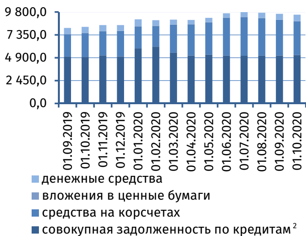
Рис. 3. Динамика основных видов активов, млн руб.

чего её остаток сократился на 7,6 млн руб. (-0,3%), составив на 1 октября 2020 года 2 868,3 млн руб. (рис. 4). В то же время продолжился рост потребительского кредитования: задолженность физических лиц возросла на 6,6 млн руб. (+0,6%), до 1 124,1 млн руб.